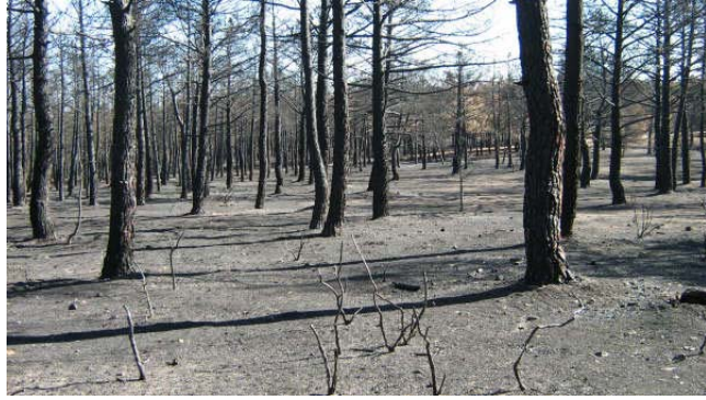
Un aspecto del pinar quemado, en Moral de Hornuez. (Fotografía: Manuel López Lázaro. 24-8-08.)