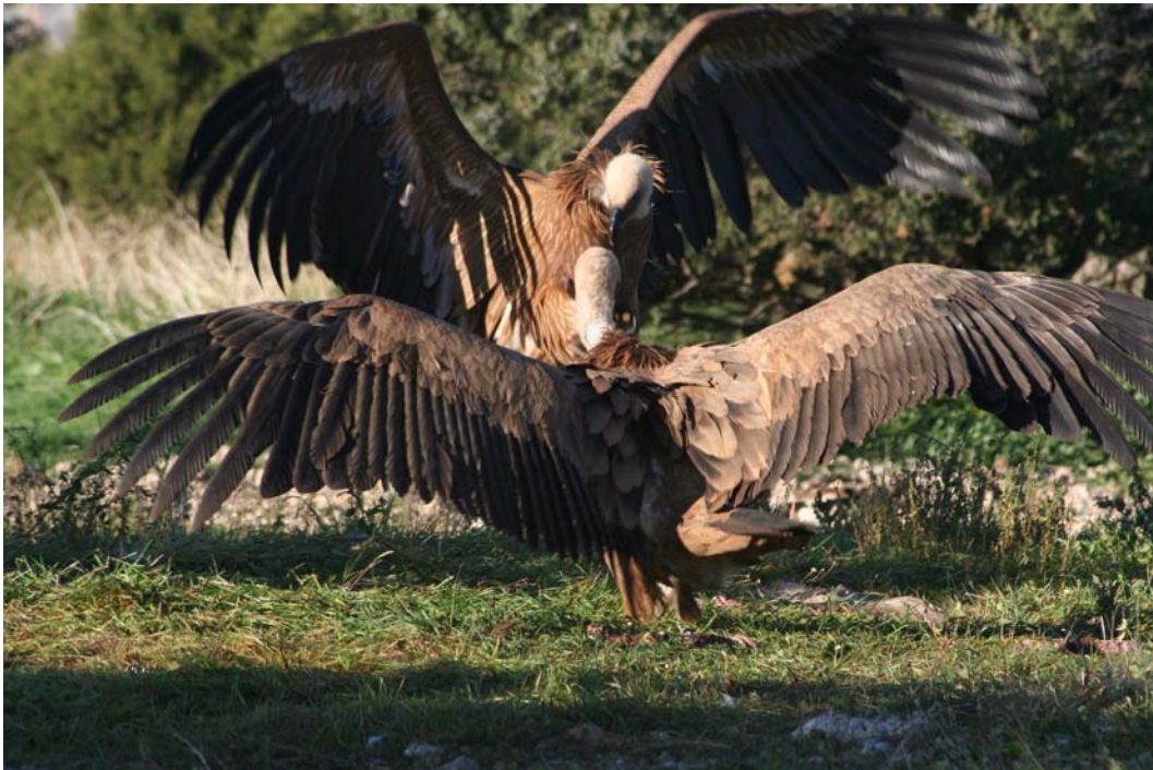
Disputa de dos buitres inmaduros en un festín, en el comedero del Refugio de Montejo.