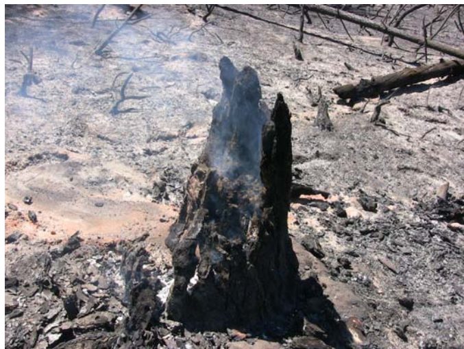
Un tocón aún humeante, después del incendio. (Fotografía: Xavier Parra Cuenca. 9 de agosto de 2008.)