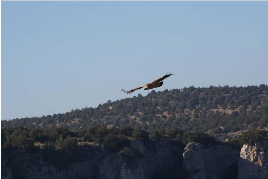
Buitre leonado en las hoces del Riaza. (Fotografía: Elías Gomis Martín. 13 de noviembre de 2007.)