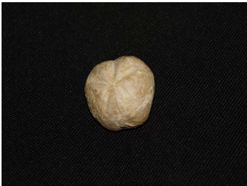
TOXASTER (erizo de mar)