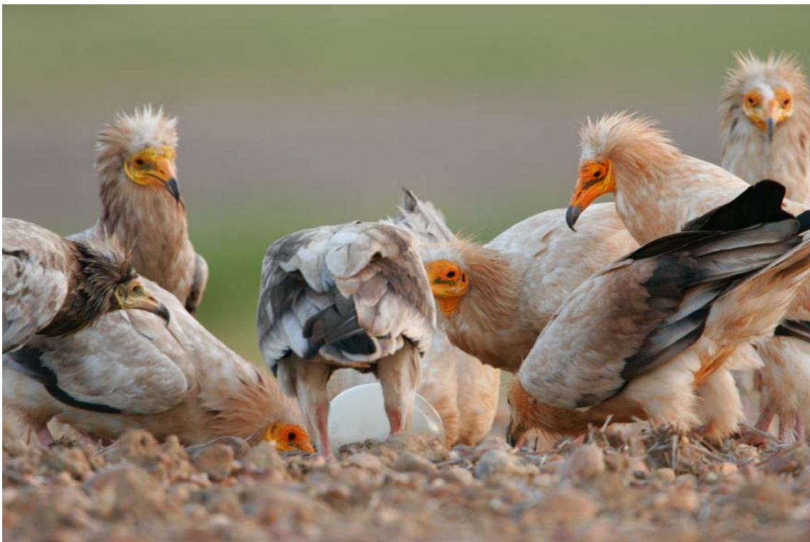
Alimoche junto a un huevo de avestruz, en el comedero de Campo de San Pedro. (22 de junio de 2008.)