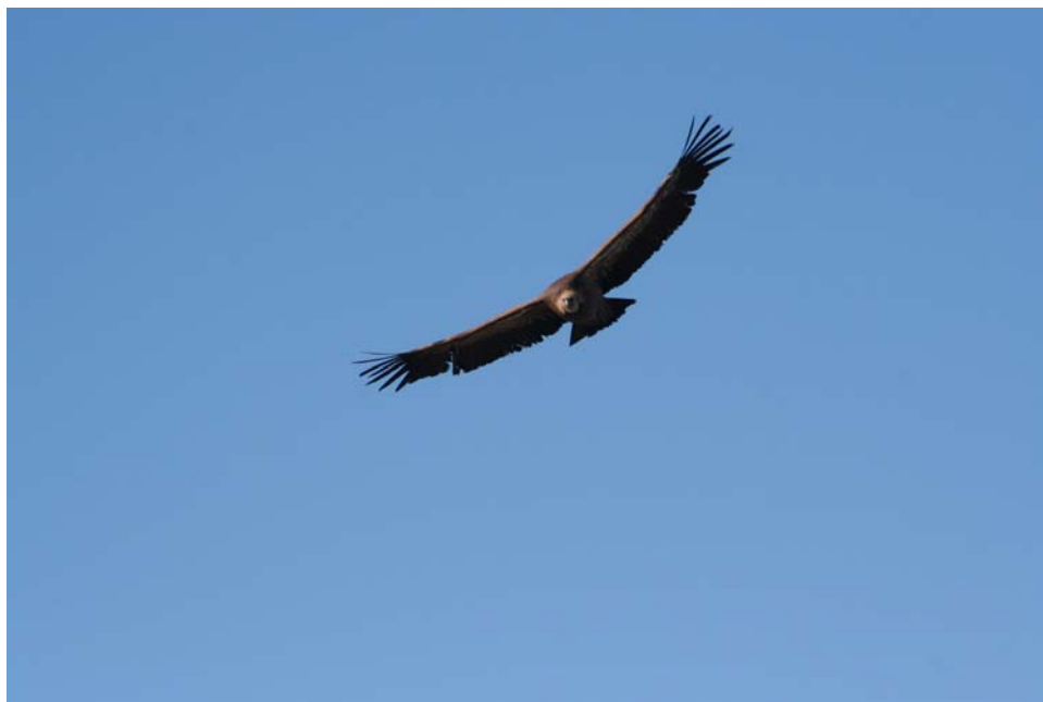
Buitre leonado en vuelo, en el Refugio. (13 de noviembre de 1007.)

El total de aves anilladas en las hoces del Riaza, durante los 34 años de la historia del Refugio, es de al menos 3.839, de 94 especies distintas, según los datos que conocemos; y sin contar varios cientos de aves anilladas (y algunas especies más) en zonas cercanas del nordeste de Segovia. No se incluyen en las cifras anteriores las aves anilladas recientemente en el Parque Natural por encargo de la Junta de Castilla y León, pues la dirección del Parque no ha comunicado ni publicado (hasta ahora) esa información.