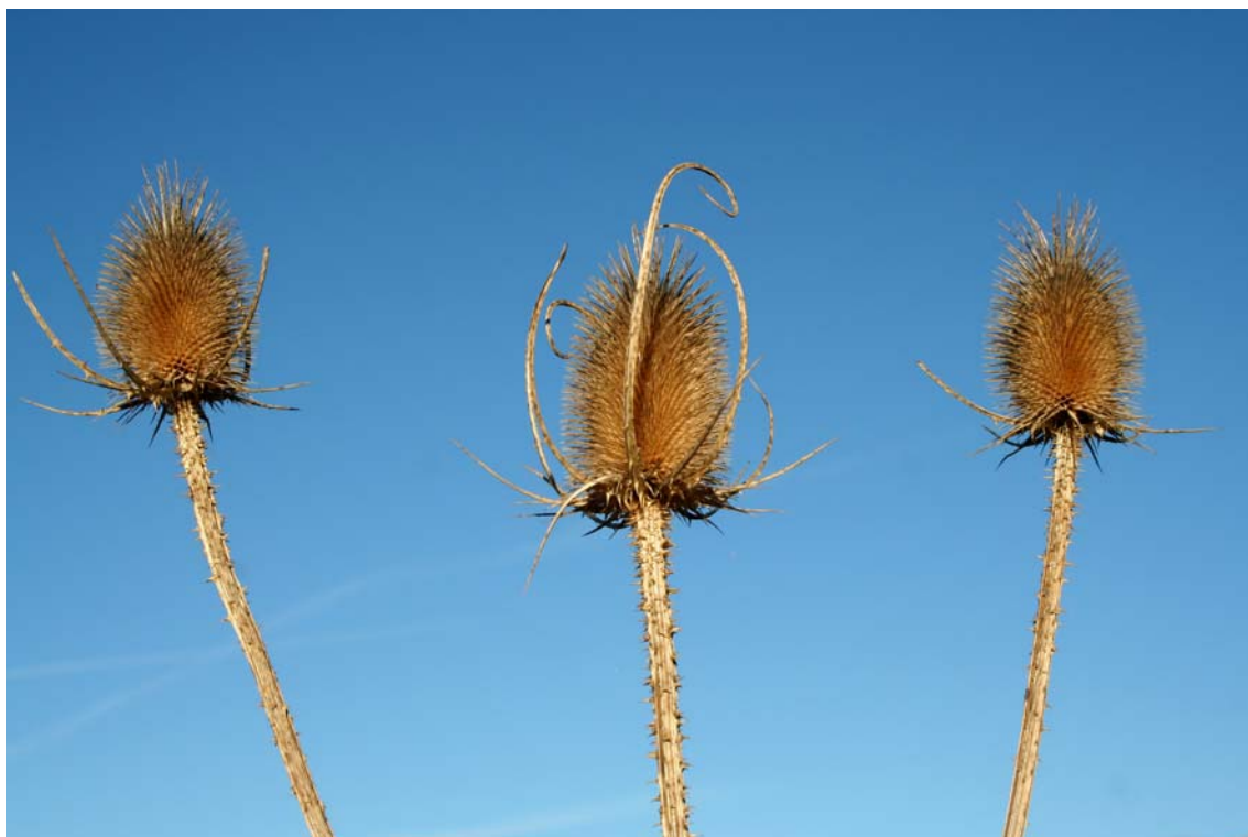
(Fotografía: Elías Gomis Martín. 12 de noviembre de 2007.)

4) Durante el censo de otoño de 2007, Elías Gomis Martín obtuvo bonitas fotografías de cardos, al parecer de la especie Dipsacus sylvestris (cardo de cardador).