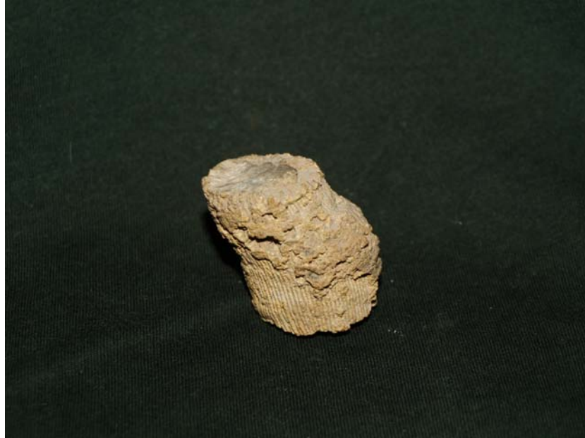
Posible TURBINOLIA (polipero)