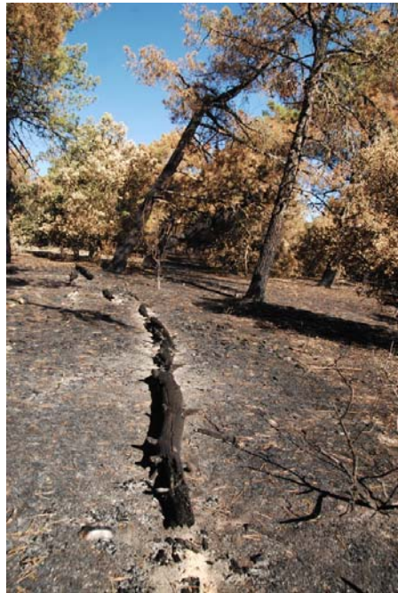
Unos árboles se han quemado del todo, y otros no. (Fotografía: Fernando Alarcón García. 24-8-08.)