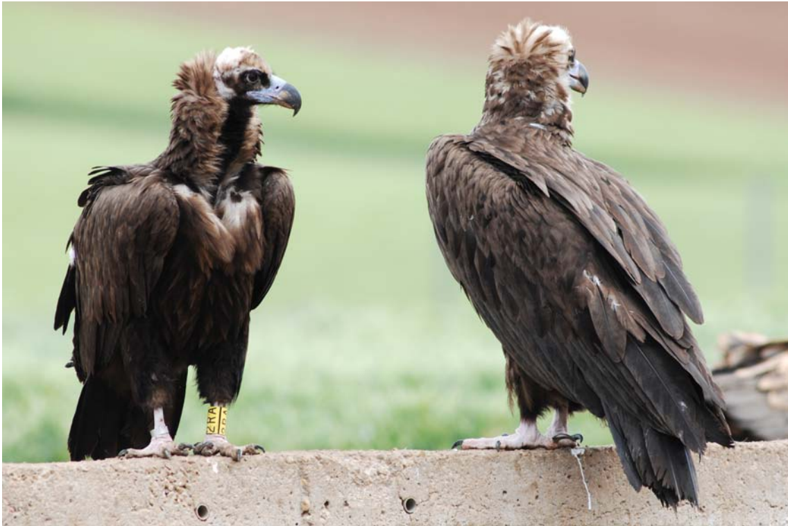
Buitres negros, en el comedero de Campo de San Pedro. Nótese la anilla 2RA. (Fotografía: Fernando Alarcón García. 26 de mayo de 2008.) (Véase la nota de la página anterior).