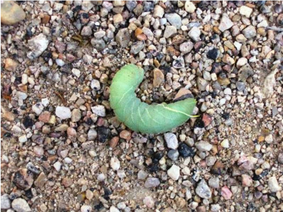
Oruga de esfinge, cerca de la presa.