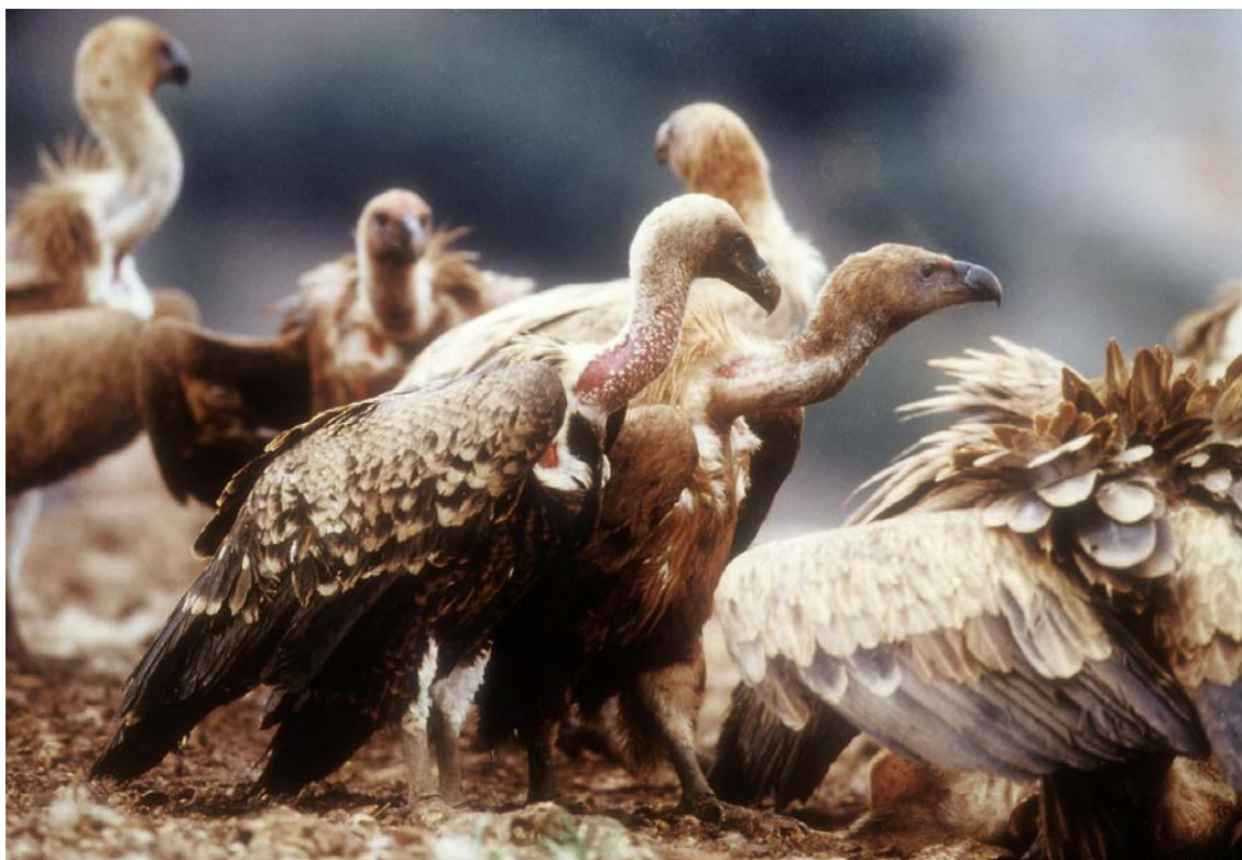
Buitre moteado subadulto, junto a buitres leonados, en el comedero de buitres del Refugio de Montejo. (Fotografía: Joachim Griesinger. 17 de marzo de 2002).