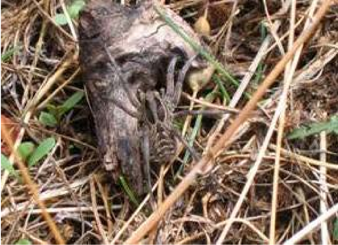
Tarántula, en El Casuar.