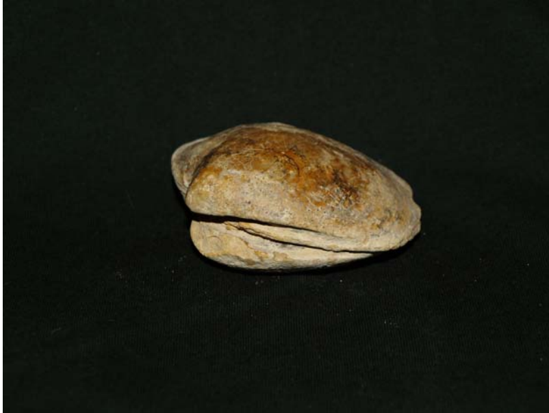
Molusco Bivalvo (posible Plagiostoma Gigantea )