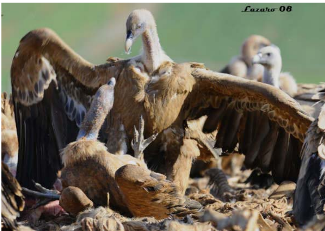
Lucha de buitres leonados en un festín, en el comedero de Campo de San Pedro. (15 de mayo de 2008.)

Los 2-3 alimoches incluían un adulto, y un inmaduro / subadulto del tercer o cuarto año.