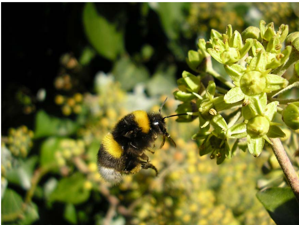
Abejorro en Montejo. (Fotografía: Elías Gomis Martín. 11 de noviembre de 2007.)

10) El 11 de noviembre de 2007 , en las afueras del pueblo de Montejo, Elías Gomis Martín obtuvo varias fotografías de un abejorro, posiblemente un abejorro zapador ( Bombus terrestris ).