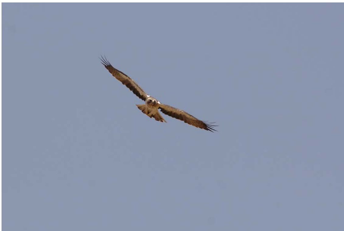
Águila calzada de fase clara, cerca de Campo de San Pedro. (Fotografía: Fernando Alarcón García. 1 de agosto de 2007.)

(Véanse las Hojas Informativas N° 24 , pág. 99; N° 27 , págs. 217-218; y N° 30 , pág. 172).