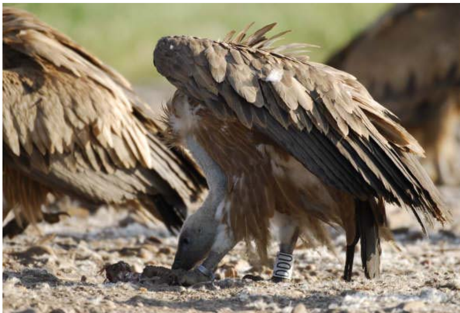
Buitre leonado con anilla blanca DDU, en el comedero de Campo de San Pedro. (Fotografía: Manuel López Lázaro. 13 de mayo de 2007.)

DDU (anilla blanca; fotografiado; con anilla metálica en la pata izquierda; la anilla amarilla se lee de abajo arriba).- Puede proceder de la reserva del valle de Ossau (en el Pirineo francés). (D. 7.415).