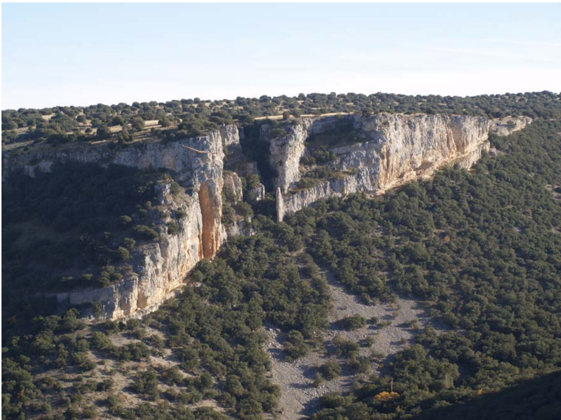
Margen derecha del barranco de Valugar. (Abril de 2002.)